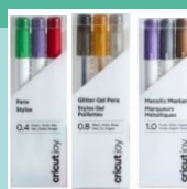
Stylos & Feutres