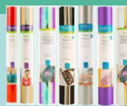
Flex/Thermocollants & Vinyle adhésif