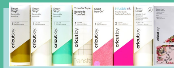
Smart Vinyl, Smart Iron-On, Infusible Ink, Smart Labels, bandes de Transfert et Deluxe Paper (Adhésif)