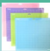
Tapis de découpe