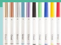
Stylos & Feutres