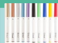
Stylos & Feutres