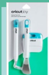
Starter Tool Set