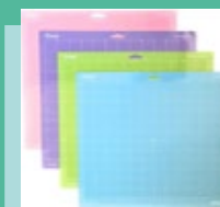
Tapis de découpe