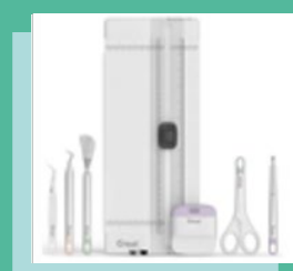
Kit d'outils essentiel