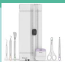
Kit d'outils essentiel