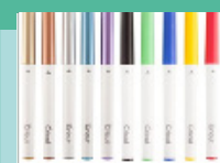
Pens & Markers