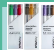
Pens & Markers