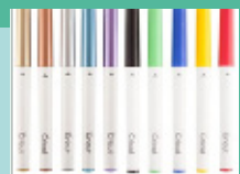
Pens & Markers