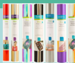
Iron-On & Adhesive Vinyl