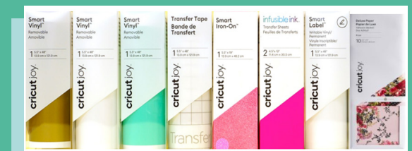
Smart Vinyl & Iron-On, Infusible Ink, Smart Labels, Transfer Tape and Adhesive Backed Deluxe Paper