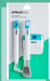
Starter Tool Set