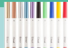
Pens & Markers