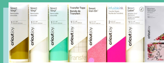
Smart Vinyl & Iron-On, Infusible Ink, Smart Labels, Transfer Tape and Adhesive Backed Deluxe Paper