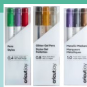
Pens & Markers